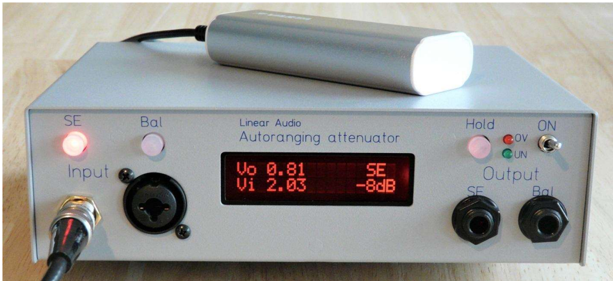
Figura 1 – Pannello frontale dell'AR.

I controlli e gli indicatori dell'AR sono raggruppati logicamente in base al flusso del segnale dall'ingresso all'uscita, vedi figura 1 .